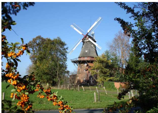
Hollandwindmühle - Brockel

Etwas gemeinsam für die Dorfgemeinschaft schaffen, gemeinsam mit anderen Dörfern zum Erhalt der sozialen Infrastruktur beitragen oder neue Wege z.B. im Tourismus gehen.