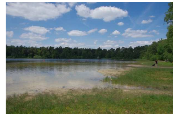
Bullensee - Kichwalsede