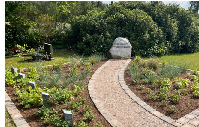
Neu angelegtes Urnengräberfeld in Riekenbostel. Statt auf Steinplatten im Rasen, sind die Namen der Verstorbenen auf Stelen im Staudenbeet zu lesen.