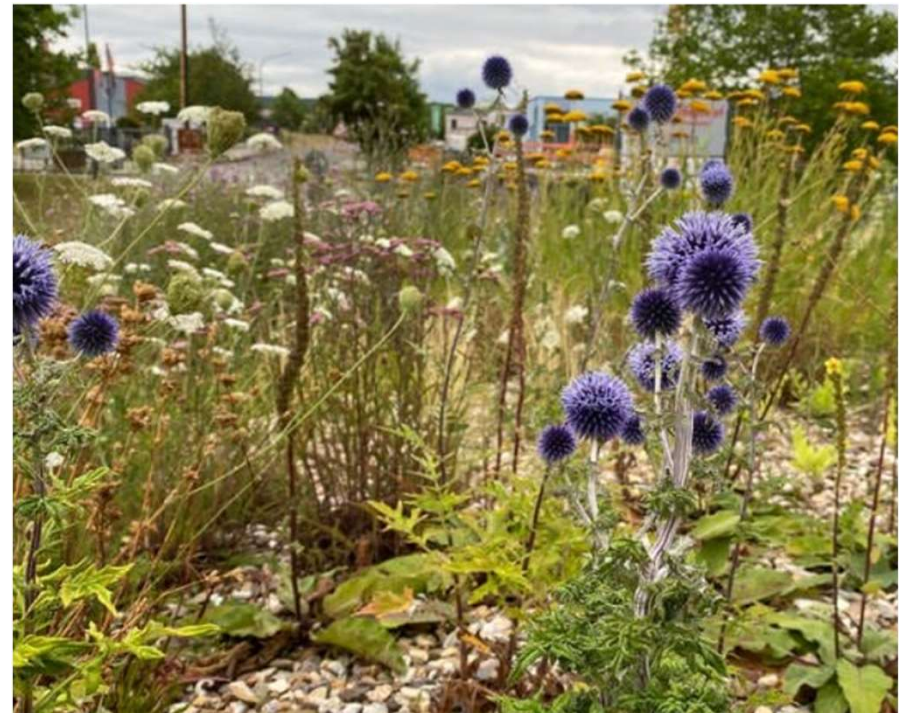
Magerbeet auf einem Kreisel in der Gemeinde Föhren (Landkreis Trier-Saarburg)

© Idylle trotz Dürre: Grünfläche in Föhren kommt ohne Wasser aus - SWR Aktuell