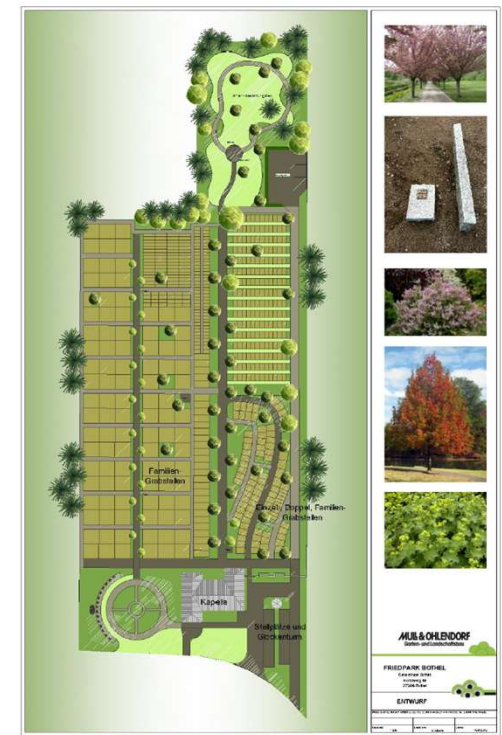
Friedpark Bothel (Gemeinde Bothel)